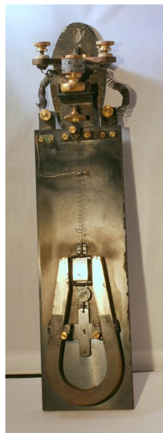
Modèle Chauvin et Arnoux nr 2962 - Paris Série A - Résistance du cadre : 8 ohms